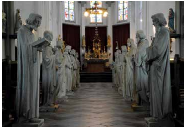
De twaalf apostelen

De volgende is Matthias. Hij werd door loting aangewezen om de opengevallen plaats van de voormalige apostel Judas Iskariot, na diens verraad en zelfmoord, op te vullen. In de nieuwe kalender wordt zijn feest op 14 mei gevierd, maar voor die tijd was zijn lotdag 24 februari. Op die dag zijn de volgende spreuken gebaseerd. "Als Sint Mathijs geeft sneeuw en ijs, dan kan men verwachten dat het vriezen zal nog veertig nachten". "Sint Mathijs breekt het ijs, maar als het niet wil breken dan vriest het nog zes weken" en "Na Sint Mathijs waagt niemand zich nog op het ijs". Dan volgt Philippus. Diens lotdag gaat samen met die van Jacobus de Mindere. "Als het op Sint Philippus regent, dan is de oogst gezegend" en "Philippus en Jacobus, portieren van de mei, draag zorg voor onze wei, breng af en toe wat regen en zegen allerwegen, wat koelte en wat nat, dat vult kelder, beurs en vat".