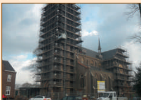
Museum in de steigers