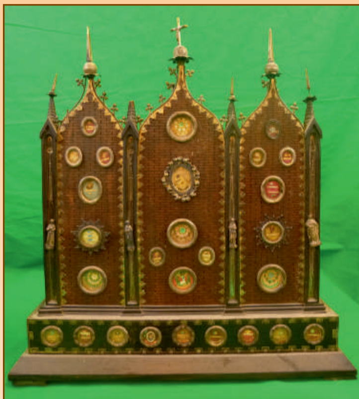
Religieuze voorwerpen in de thematentoonstelling