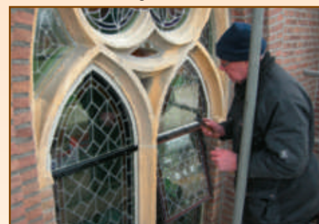
Glas in lood vervanging